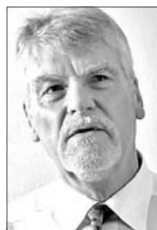
Gerd Eisenbeiß, 68, Physiker, war bis 2006 Vorstand im Forschungszentrum Jülich. Zuvor arbeitete er am Deutschen Zentrum für Luft- und Raumfahrt und im Bundesforschungsministerium.

In Frankreich und anderen Ländern Europas wurde von Kernenergie-Gegnern ähnlich argumentiert wie in Deutschland; da lag und liegt also nicht der Unterschied. Die Debatte fand dort aber nicht vor dem Hintergrund eines nationalen Schuldgefühls statt, sodass es dort zu keiner Eskalation wie in Deutschland kam. Sie blieb dort eine Auseinandersetzung von vielen. In den Vereinig-